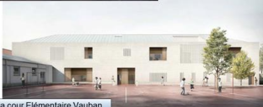
Vue panoramique depuis la cour Élémentaire Vauban