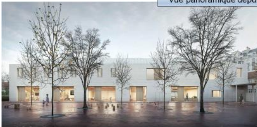
Vue panoramique depuis la cour Maternelle Vauban